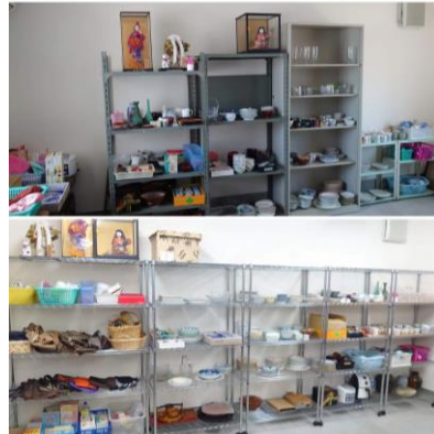
食料庫 ビフォーアフター